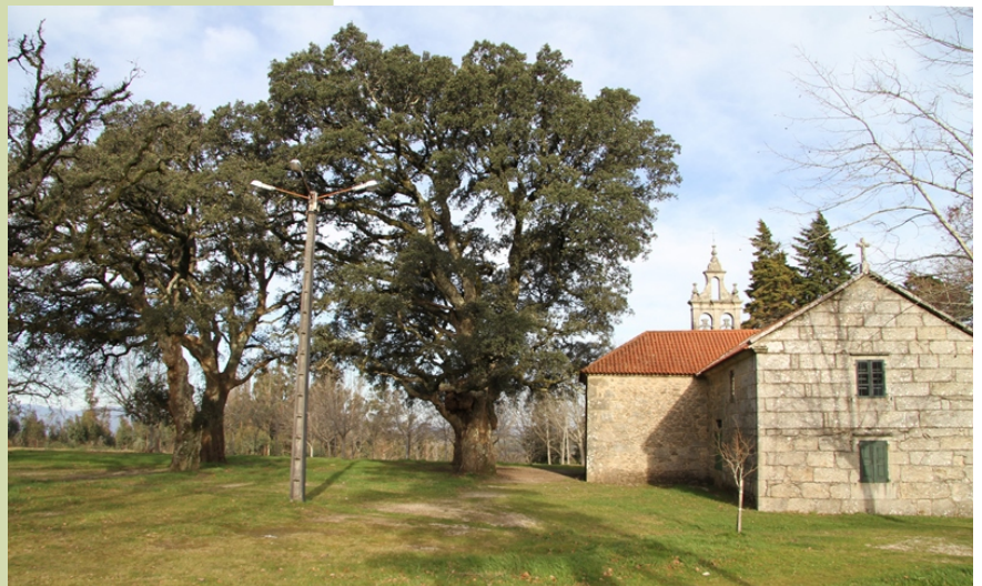
Sobreiras do Adro da capela dos Miragres de Requián. (Frades, A Estrada). A máis grande mide 4,80 m de perímetro.