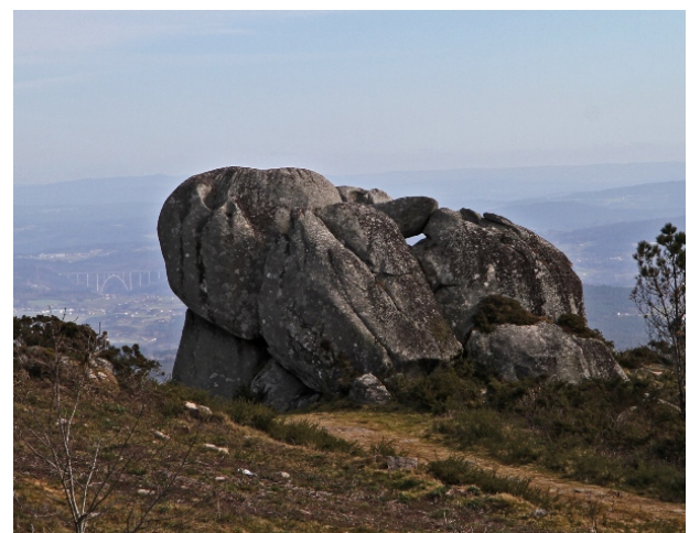
Pedra da Águia.

Unha camiñada con distintos graos de dificultade os máis complicados dous curtos tramos, un de subida e outro de baixada, no cortalumes polo que se sube e a pendente do cortalumes de baixada, pero nada que non se poida arreglar con precaución, uns bos bastóns e un calzado axeitado.