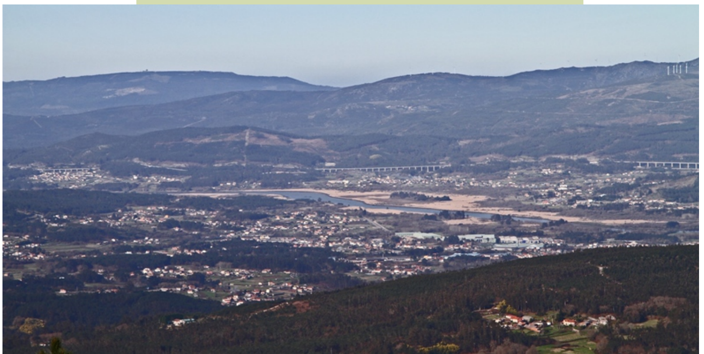
Panorámica de Valga e o tramo final do curso do Ulla.